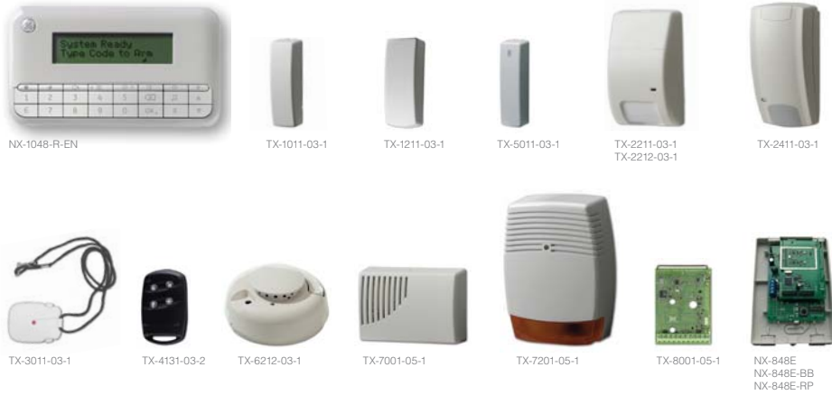
NX-1048-R-EN TX-1011-03-1 TX-1211-03-1 TX-5011-03-1 TX-2211-03-1 TX-2411-03-1 TX-3011-03-1 TX-4131-03-2 TX-6212-03-1 TX-7001-05-1 TX-7201-05-1 TX-8001-05-1 NX-849E NX-848E-BB NX-848E-RP