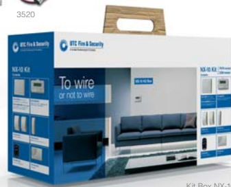
Kit Box NX-10