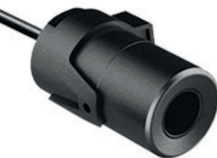
TVL - 0103 Mini Cylindre Objectif 4 mm