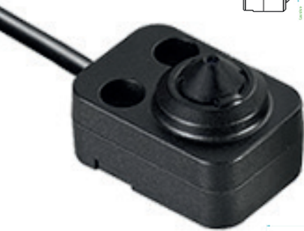
TVL - 0102 Pinhole en L Objectif 3.7 mm