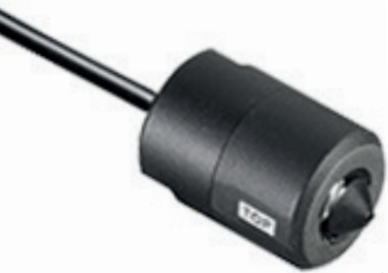
TVL - 0101 Pinhole Objectif 3.7 mm