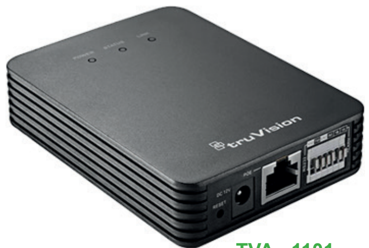
TVA - 1101 Boitier de gestion